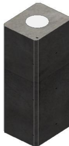
FÄRDIG PRODUKT 1:200