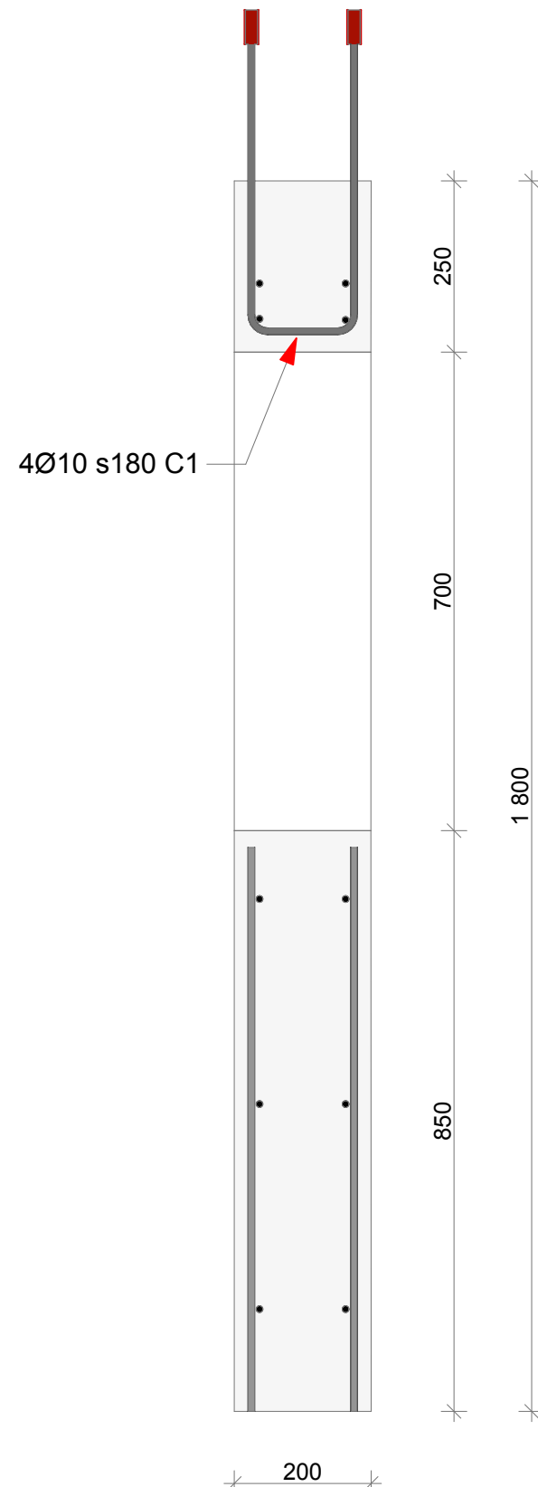
A7 V1800 SEKTION C1-BYGEL (1) 1:10